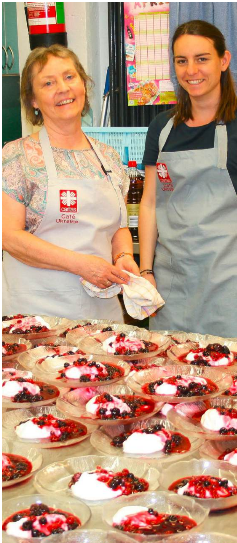
Zu einem guten Mittagessen gehört auch eine leckere Nachspeise – Caritas sei Dank!

Kontoinhaber: Caritasverband Konstanz e.V. IBAN: DE29 6905 0001 0000 0688 66 BIC: SOLADES1KNZ Stichwort: Mittagstisch