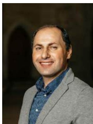
Basel Malke Konstanz Petershausen