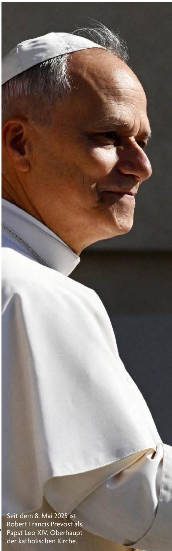
Seit dem 8. Mai 2025 ist Robert Francis Prevost als Papst Leo XIV. Oberhaupt der katholischen Kirche.

Das liegt, wie Leo XIV. in dem Schreiben ausdrücklich betont, nicht allein an der Tatsache, dass er für seinen Text Vorarbeiten seines argentinischen Vorgängers Franziskus verwendet hat. Vielmehr macht er sich ausdrücklich die Lehren der fünf großen lateinamerikanischen Bischofsversammlungen von Medellín (1968) bis Aparecida (2007) zu eigen und bescheinigt ihnen, dass die die Lehre der gesamten Kirche zu sozialen Fragen nachhaltig geprägt hätten. Diese prägenden Versammlungen der lateinamerikanischen Bischöfe bezeichnet Leo XIV. als wichtige Meilensteine für die gesamte Kirche und schreibt: „Ich selbst, der ich viele Jahre als Missionar in Peru tätig gewesen bin, verdanke diesem Weg der Unterscheidung in der Kirche, den Papst Franziskus klug mit dem Weg anderer Teilkirchen, insbesondere im globalen Süden, zu verbinden wusste, sehr viel.“ In den folgenden Abschnitten betont Leo XIV. seine Kontinuität mit dem in der Weltkirche lange umstrittenen lateinamerikanischen