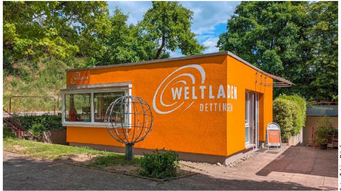
Der Weltladen Dettingen an der Dingelsdorfer Straße – das Fachgeschäft für Fairen Handel auf dem Bodanrück.

Seit dem Jahr 1993 gibt es in Dettingen einen Weltladen. Er wurde gegründet unter dem Dach der Kirchengemeinde St. Verena. Die dort angebotenen Produkte stammen aus Fairem Handel. Dieser steht für partnerschaftliche und verlässliche Handelsbeziehungen mit benachteiligten Produzentinnen und Produzenten in den Ländern des Südens. Durch kostendeckende, faire Preise, langfristige Handelsbeziehungen, Vorfinanzierung und Beratung verbessern sich die Lebens- und Arbeitsbedingungen von Kleinbauernfamilien und Handwerkern im Süden. Zudem ist der Schutz von Mensch und Umwelt ein wichtiges Anliegen. Getreu dem Motto „Wandel durch Handel“ profitieren unzählige Menschen von einer Handelspartnerschaft auf Augenhöhe, jenseits von Spenden und Almosen. Der Faire Handel will auch Menschen im Norden zu einem bewussten Einkaufsverhalten und einem