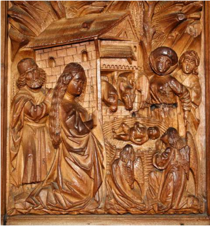
Jesu Geburt. Ausschnitt aus dem Westportal des Konstanzer Münsters, ca. 1470. Beachtenswert ist, dass die Türen aus Holz geschaffen wurden und fast unbeschadet erhalten sind. Trotz einiger Brände in der Geschichte des Münsters beeindrucken die kunstvoll geschnitzten Türen aus Nussbaumholz immer noch.