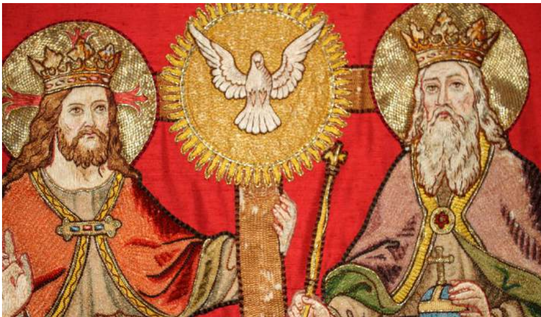
Darstellung der Heiligen Dreifaltigkeit auf einem Pluvialen (Rauchmantel)

Auch die Verantwortung für die Pfarrei Heilige Dreifaltigkeit Konstanz verteilt sich auf mehrere Personen und so ist die Investitur mehr als nur ein formaler Akt, der mit der Einsetzung des Pfarrers einen Rechtsakt in liturgischem Kontext vollzieht. In diesem Gottesdienst feiern wir ganz bewusst als Gemeinschaft den Weg in die neue Pfarrei. Daher sieht die Investitur auch vor, die Mitglieder des Kernteams und Seelsorgeteams, von Pfarreirat und Gemeindeteams sowie der Verwaltung in diese Feier mithineinzunehmen und alle, die den Weg hin in die neue Pfarrei mitgehen.