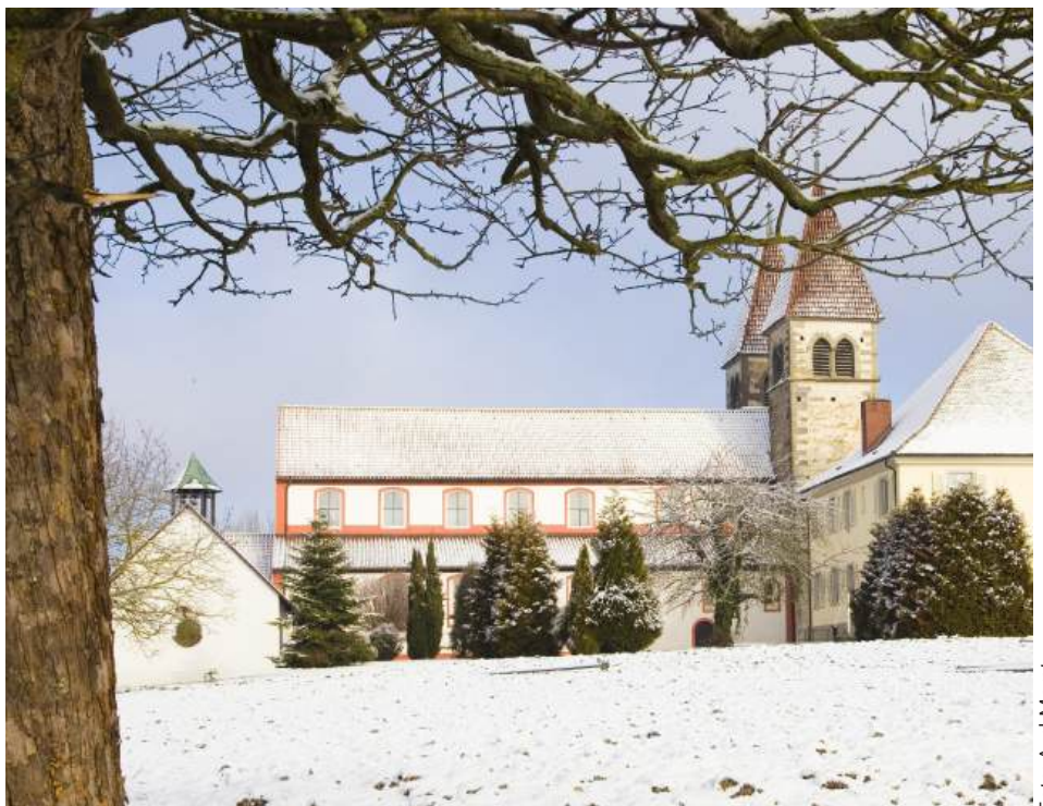
Kirche St. Peter und Paul, Reichenau Niederzell