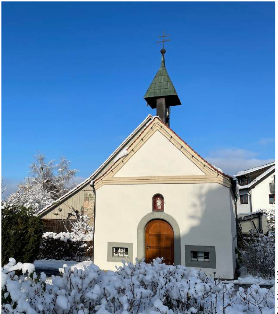
Kapelle St. Josef, Konstanz Egg

So finden Sie weiterhin wie gewohnt alle Informationen zu Werktagsgottesdiensten, Zelebranten und Messintentionen in den Blättchen oder Amtblättern, die wie bisher in den verschiedenen Kirchen ausgelegt sein werden oder in Ihren Briefkästen landen. Da diese Informationen jeweils für die Gemeinden vor Ort Relevanz haben, werden diese auch weiterhin dort veröffentlicht und verteilt. Ihnen fehlt darüber hinaus noch etwas? Melden Sie sich gerne bei uns: kommunikation@kath-konstanz.de .