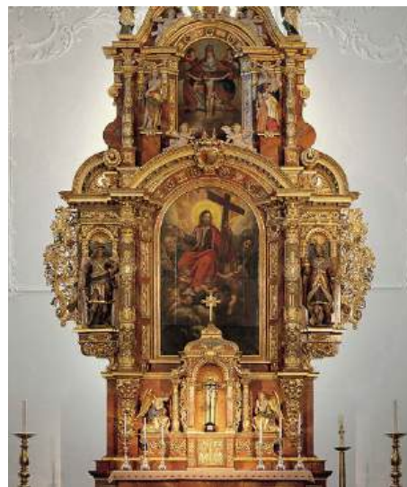
Bild oben: Blick in den Innenraum der Dreifaltigkeitskirche mit ihren Stuckverzierungen und Fresken. Bild links: Der Hochaltar stand einst in einer Kirche im schweizerischen Zug. Das obere Altarbild zeigt eine Darstellung der Dreifaltigkeit.

Kunsthändler erfahren hatte, dass im schweizerischen Zug Altäre und eine Kanzel aus einer abgebrochenen Kirche zu erwerben seien, machte er sich dorthin auf. Auf dem Rückweg hatte er einen Hochaltar, zwei Seitenaltäre und eine Kanzel mit Baldachin im Gepäck. Alles barocke Meisterwerke aus dem