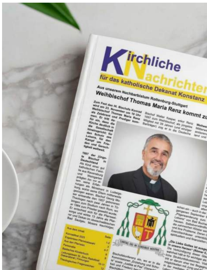
Die vorletzte Ausgabe des KN; immer aktuell und gut recherchiert